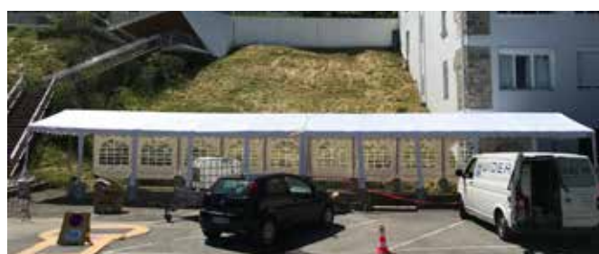
2 chapiteaux de 10 x 5 mètres (ici assemblés).