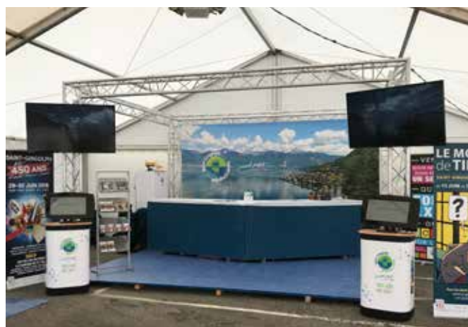
Structure métallique et écrans.