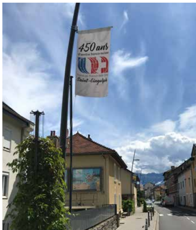
Potences sur les lampadaires.

Nous anticipons sur le rapport de gestion 2020 en vous informant que la commune française, que nous remercions, nous a mis à disposition au début de l'année 2020 des nouveaux locaux à proximité de notre entrepôt principal. Ainsi, le matériel spécifique à la Fête de la Châtaigne et aux différents marchés sera sorti de l'entrepôt principal, et nous allons pouvoir enfin organiser ce dernier.